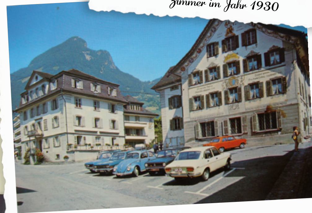
Postkarte aus dem Jahr 1970

Ein Werk von Frauen für Frauen geschaffen