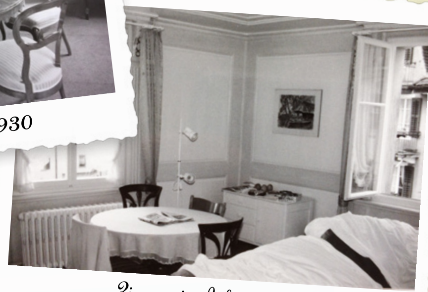
Zimmer im Jahr 1930