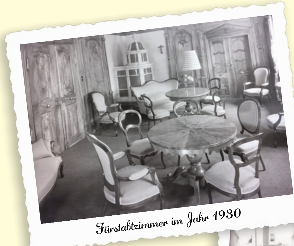
Fürstabtzimmer im Jahr 1930