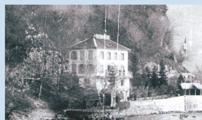
Seehof Galgenbergli Felsenheim um 1895