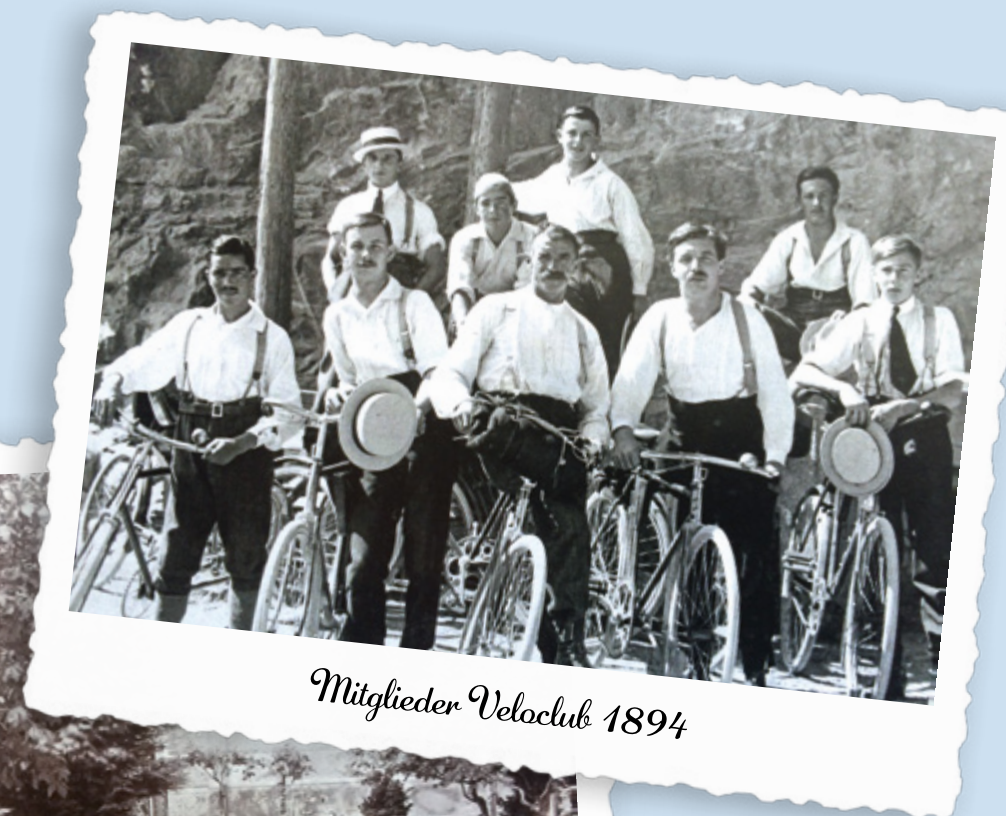
Mitglieder Veloclub 1894

Den kompletten Text inkl. Fotos zum downloaden finden Sie unter: www.gersautourismus.ch/kultur/ortsmuseum