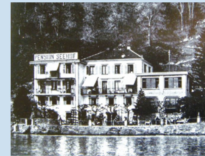
Pension Seehof mit neuem Anbau Ost

verkaufte Hotelier Rudolf Lagler seine Liegenschaft «Hotel Seehof und Zugehör» Nr. 370, «Galgenbergli oder Felsenheim» Nr. 330 und Parkplatz zum Hotel Seehof Nr. 504 GB zum Kaufpreis von CHF 420'000.- an den Schweiz. Papier-, Textil- und Fabrikarbeiterverband .