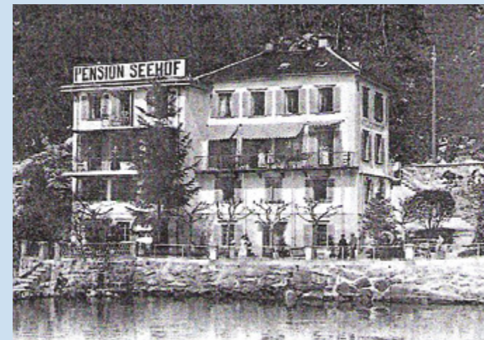
Pension Seehof mit neuem Anbau West 1904

In verschiedenen Bauperioden wurde die Liegenschaft zum Hotel «Seehof» ausgebaut. Die Bettenanzahl betrug 55 und die Pensionspreise in der Hochsaison CHF 6.- und in der übrigen Zeit CHF 5.50 pro Person.