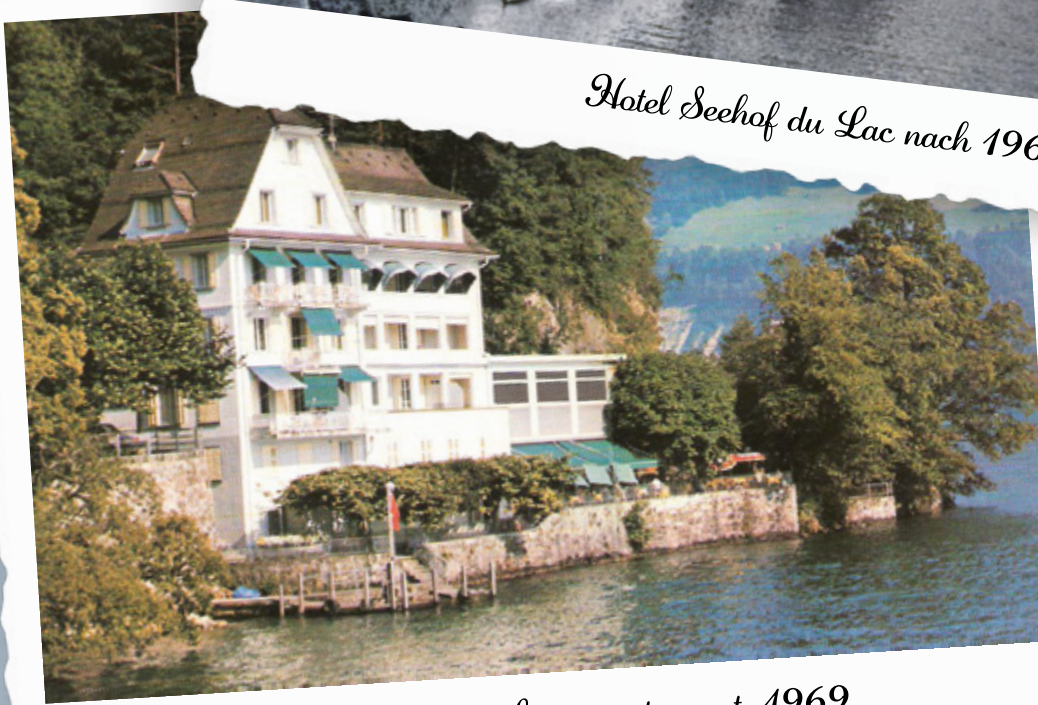
Hotel Seehof mit Gartenrestaurant, 1969