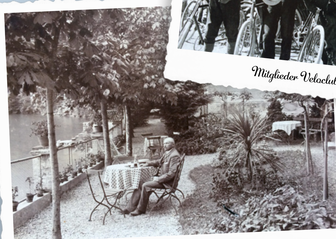
In der Gartenanlage, Photographie 1904 von F. Beeler, Brunnen