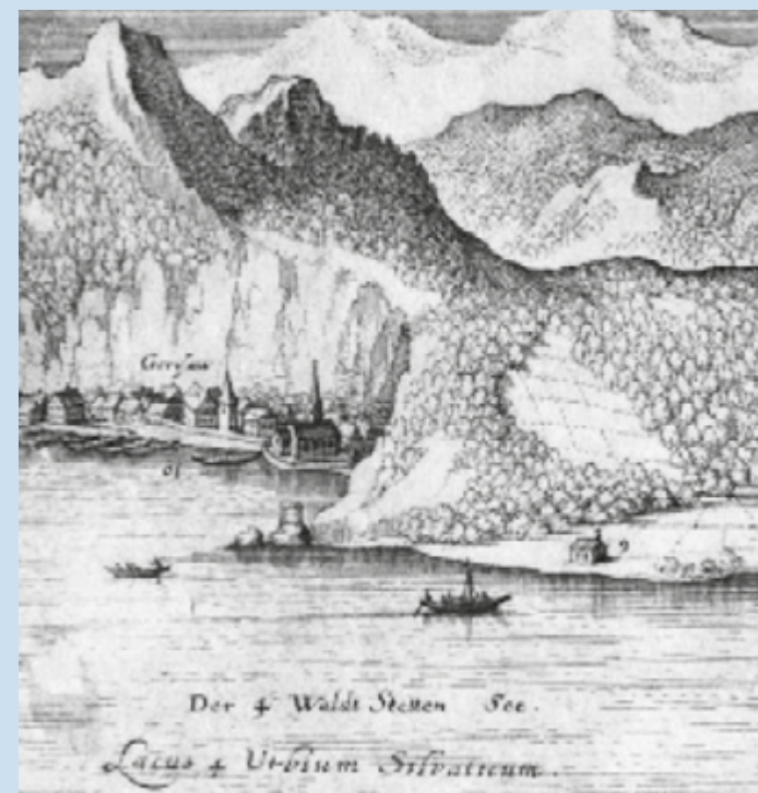
Kupferstich Matthäus Merian „Svitia, Schweytz“ um 1642, Ausschnitt Gersau mit Galgen

Auf der östlichen Seite der Ortschaft Gersau, in einer Seebucht, befand sich ehemals auf einem in den See hervorspringenden Felsenriff der Galgen der alten Republik . Der Weg dahin führte hoch oben über den Bühl und dann erst steil zum See hinunter. An der höchsten Stelle dieses Weges steht seit uralten Zeiten eine kleine Feldkapelle, bei welcher der zum Strang verurteilte arme Sünder, wenn er zum Hochgericht geführt wurde, auf seinem letzten, schweren Gang noch einmal seine Seele Gott empfehlen und die Reue um dessen Barmherzigkeit flehen konnte. Schon 1661 wird dieses «Käpeli» erwähnt. Damals musste der Besitzer vom Bühl dasselbe in Fach und Gemach erhalten.